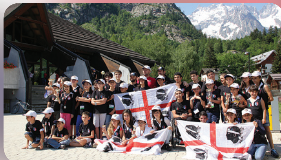
Gruppo Sardegna ai nazionali di Courmayeur 2013

Si qualificheranno direttamente alla Finale Nazionale del Campionato Italiano Under 16 di Tarvisio (UD) il 15% dei giocatori e delle giocatrici meglio classificati per ciascuna fascia di età con approssimazione per eccesso; nel conteggio valido per la qualificazione non vengono considerati i giocatori in possesso di categoria nazionale. Verranno disputati tornei distinti, Assoluti e Femminili, per ogni fascia di età; le ragazze possono scegliere se fare l'uno o l'altro purché il numero dei partecipanti sia di almeno 5. Nel caso di partecipazione poco numerosa si disputerà un torneo misto con classifiche finali separate maschili e femminili.